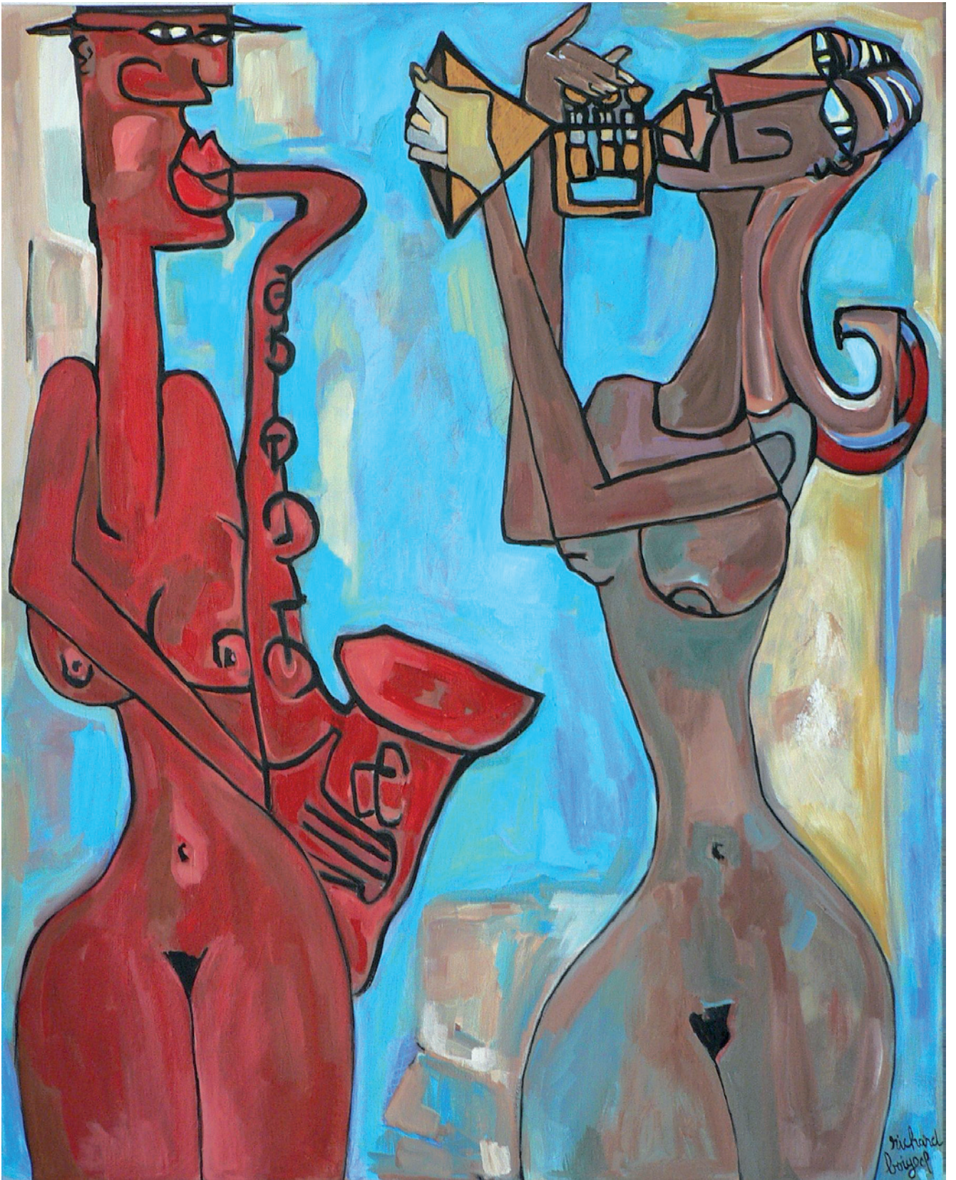
« Musiciennes » - Huile / toile - (81x65) - 2003