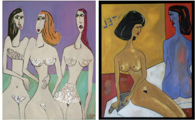
« Dessous chics » - Huile / toile et collage papier aluminium - (92x73) - 2007 « Hotel » - Huile / toile - (92x73) - 1998